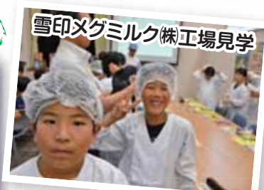
雪印メグミルク(株)工場見学