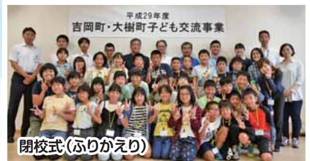
平成29年度 吉岡町・大樹町子ども交流事業