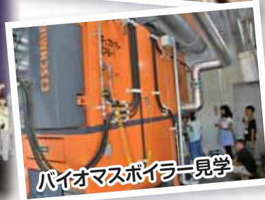
バイオマスボイラー見学