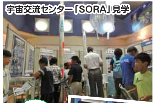
宇宙交流センター「SORA」見学