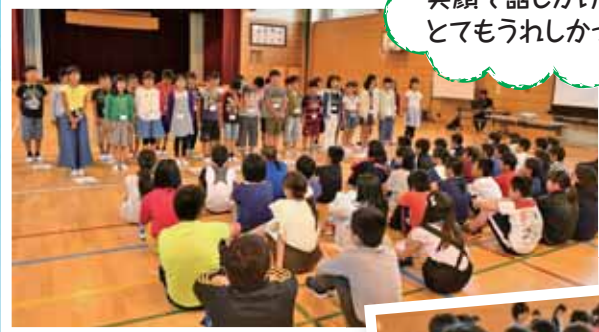
大樹小学校訪問 (お互いの町紹介)