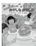
わんぱくだんのおかしなおかしや