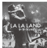
ラ・ラ・ランド (オリジナルサウンドトラック)