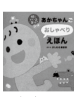
あかちゃんごおしゃべりえほん