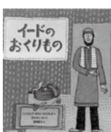
イードのおくりもの