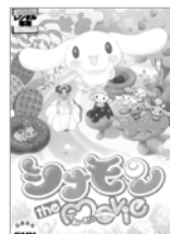
シナモンザ・ムービー