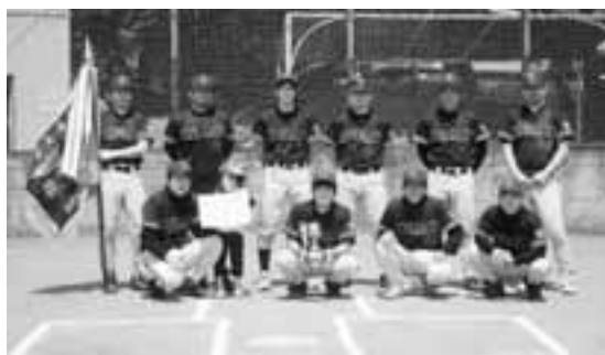
▲Aクラス 優勝 酒楽