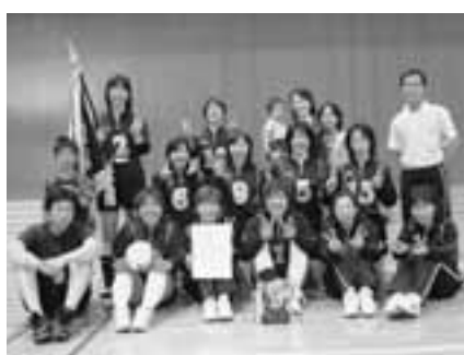
▲女子の部 優勝 第9区