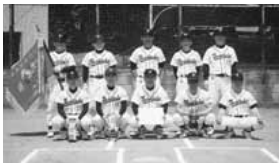
▲Bクラス 優勝 (吉岡球愛倶楽部)