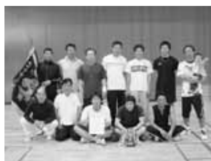
▲男子の部 優勝 第9区