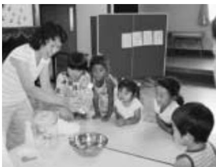
▶手を洗わずに ペットボトルをつぶさず

今年も、ダンボールやペットボトル、コカコーラ飲料といった身近な材料を使った実験が紹介され、子どもたちは楽しく参加することができました。