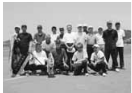
▲優勝 漆原東自治会