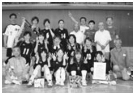
▲女子の部 優勝 溝祭自治会