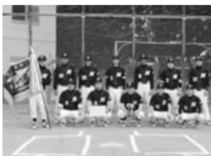
▲Aクラス 優勝 群馬丸太運輸野球部