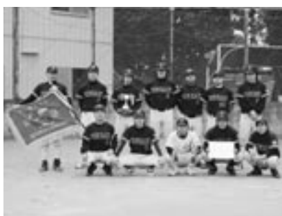
▲Bクラス 優勝 酒楽