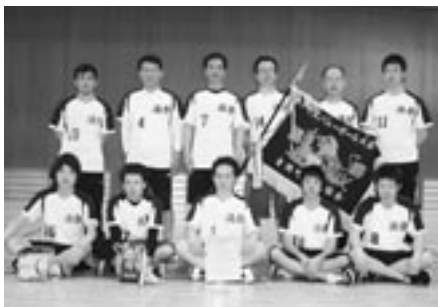
▲男子の部 優勝 溝祭自治会