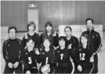
▲Cブロック優勝 溝祭レディース

3位 1区ウエルネス ▼Cブロック 優勝 溝祭レディース 準優勝 漆原西 3位 榛東排球会