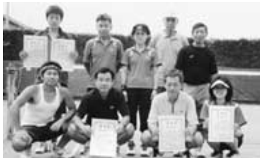
▲第40回町民ソフトテニス大会