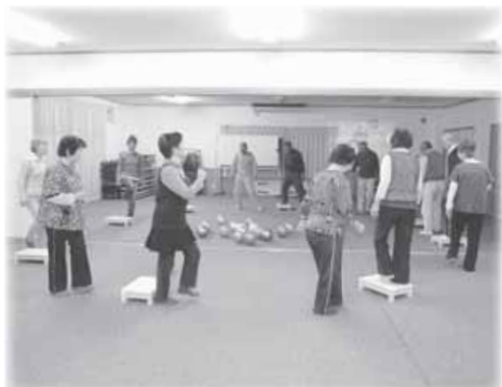
ボールを使った運動