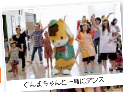
ぐんまちゃんと一緒にダンス