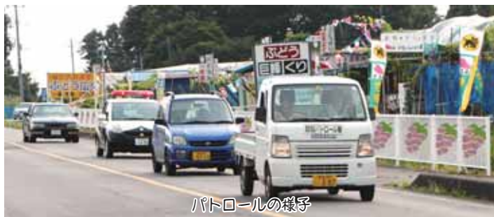
パトロールの様子

8月中旬から10月末まで、旬の品種が変わっていくので、何度か足を運ぶといろいろな種類を味わうことができます。