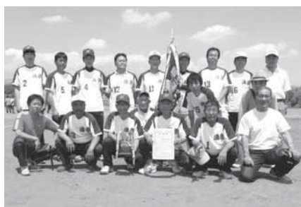
優勝 自治会 準優勝 自治会 第3位 自治会