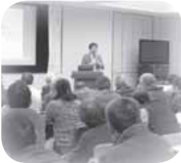
昨年度大盛況！『健康を守る黄金バランス』講習会の様子

▼対象者 町民・町内在勤者 ▼費用 無料 ▼申込方法 保健センターまたは地域の健康づくり代表推進員 ▼問合せ 保健センター ☎54・7744 (直通)