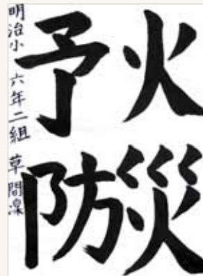
▲明治小学校 草間 凜(6年)