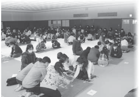
吉岡町上毛かるた大会の様子