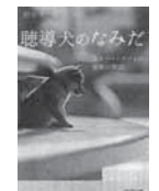
聴導犬のなみだ 野中圭一郎/プレジデント社