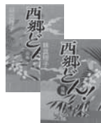
西郷どん! 前・後編 林真理子/KADOKAWA