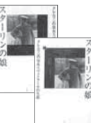
スターリンの娘 上・下巻 ロスマリー・サリヴァン/白水社