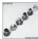
がらくた (桑田 佳祐)