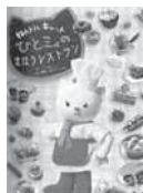
ねんどルキャットひとミイのまほうレストラン いりやまさとし/学研プラス