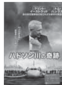
ハドソン川の奇跡