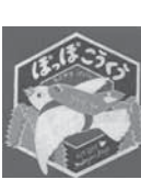
ぼっぼこうくう もとやすけいじ/佼成出版社