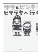
サラとピンキー ヒマラヤへ行く 富安陽子/講談社