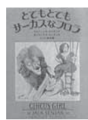
とてもとてもサーカスなフロラ モリス・センダック/集英社