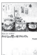
昭和30~40年代みんなの思い出アルバム