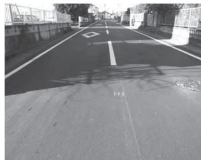
▲町道北下・長岡線