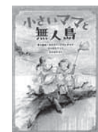
小さいママと無人島