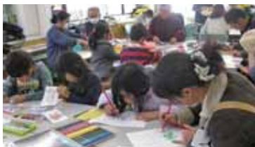
◀脳トレの コーナー