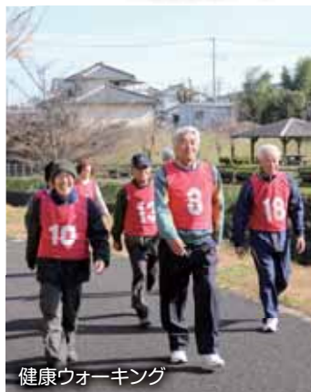
健康ウォーキング