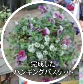
完成した ハンギングバスケット