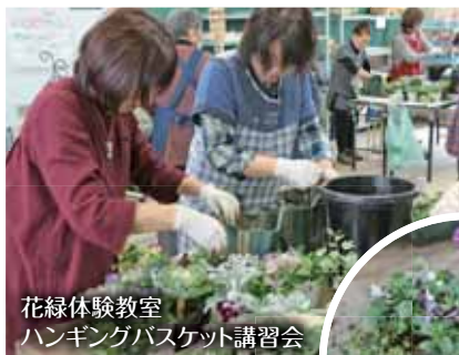
花緑体験教室 ハンギングバスケット講習会

今年の4月14日㊤から5月13日㊤に開催される「花と緑のぐんまづくり2018in吉岡」に向けて、11月23日㊤に文化センター東側のふれあい公園を中心に行われました。花緑体験イベントとしてのハンギングバスケット講習会や、屋外ステージでのお笑いライブ・ミニコンサートなどが行われ、多くの人で賑わいました。