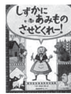
しずかにあみものさせとくれー!