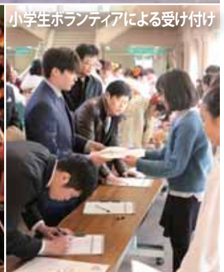
小学生ボランティアによる受け付け