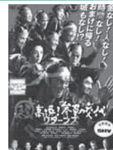
超高速! 参勤交代リターンズ