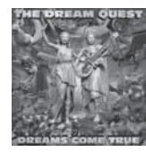
THE DREAM QUEST (DREAMS COME TRUE)