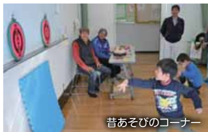
昔あそびのコーナー