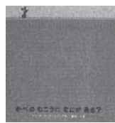
かべのむこうに なにかある?