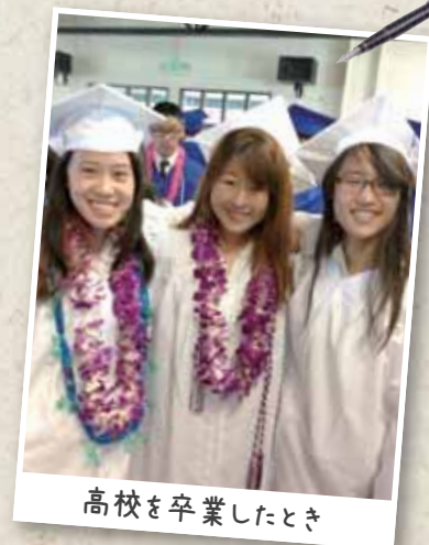
高校を卒業したとき

3月に、卒業式がありました。生徒たちや先生たちの1年間の溢れ出す気持ちに、すごく感動しました。アメリカの卒業式は日本と比べて、同じところがたくさんありますが、違うところもたくさんあります。例えば、アメリカでは卒業式は3月じゃなくて、大体6月にあります。そして、学校の時間の後に卒業式が始まります。公立学校には制服がないので、卒業生たちは特別なガウンを着て、校長先生から卒業証書を買います。それに、アメリカでは吉岡中の「花道」みたいな習慣はありませんが、卒業式の終わりに、みんなで卒業服のキャップを空に投げてお祝いします。夏の暖かい日差しの下で、あのキャップを見ると、自由な気持ちが心の中から浮かびあがってくるのを感じます。卒業式は、アメリカでも日本でも、とても嬉しくて感動するものですね。