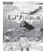
モアナと伝説の海