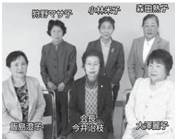
▲婦人会新役員(敬称略)