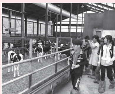
▲昨年の体験の様子