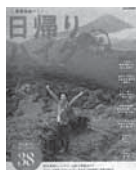
日帰りハイク関東 2018