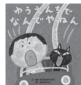
ゆうえんちで なんでもやねん