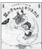
菜の子ちゃんとキツネカシ