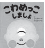
こわめっこしましょ