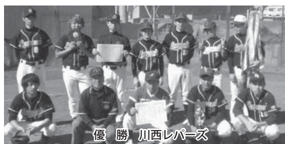
優勝 川西レパーズ