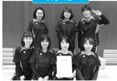
優勝 南下ハウル 準優勝 チームダイエツト