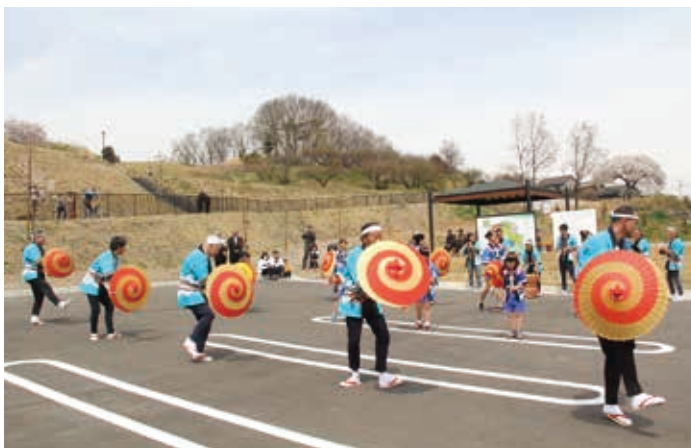
木戸八木節保存会

4月14日㊟に記念式典が行われ、城山みはらし公園が開園しました。遊び場や交流・健康づくりの場としてご利用ください。なお、植栽工事が行われている場所や芝生広場では養生のため立ち入り制限を行っています。ご協力をお願いします。この公園は、防衛省からの補助金を受けて設置されています。