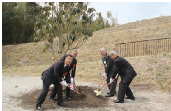
ユズリハの記念植樹