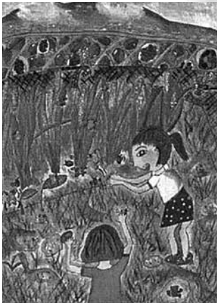
土地改良連合会長賞