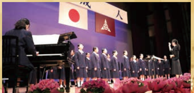
新成人の門出を祝う船尾太鼓（左）と吉岡中合唱部（右）