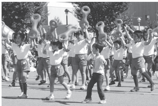
ふるさと祭り (みんなでダンス)