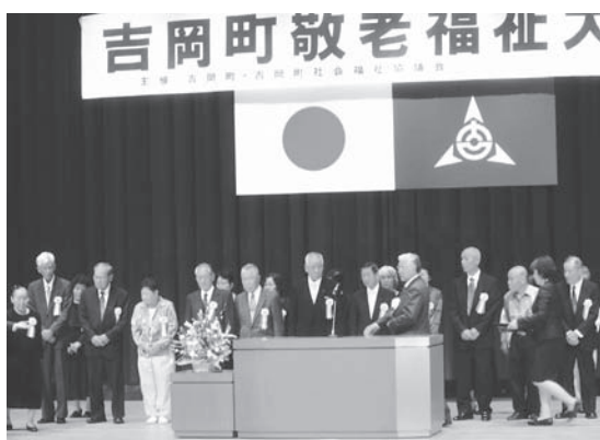
敬老福祉大会 (金婚表彰)