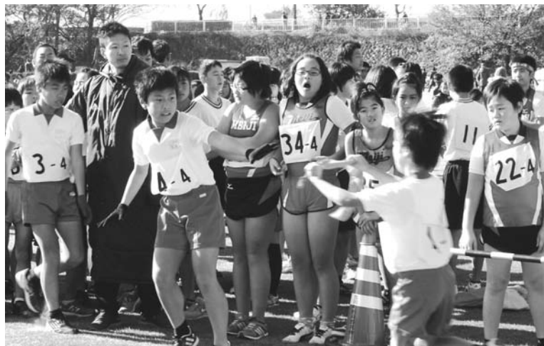
町民駅伝大会 走る