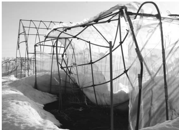
雪害を受けたビニールハウス

別収集を実施している。 町民生活課長 新し い分別収集計画を策 定中であり、プラスチック 製品の包装と容器を分別し て再利用する計画である。