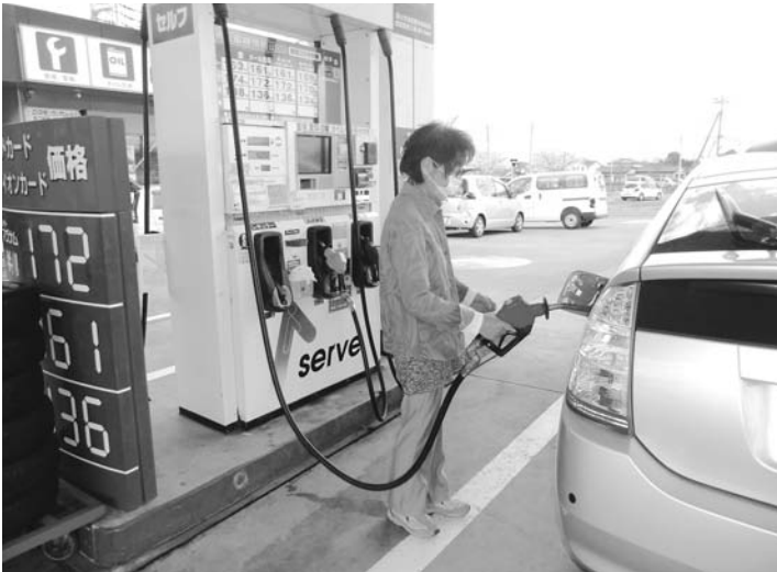
消費税増税の影響は！