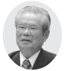
神宮 隆 議員