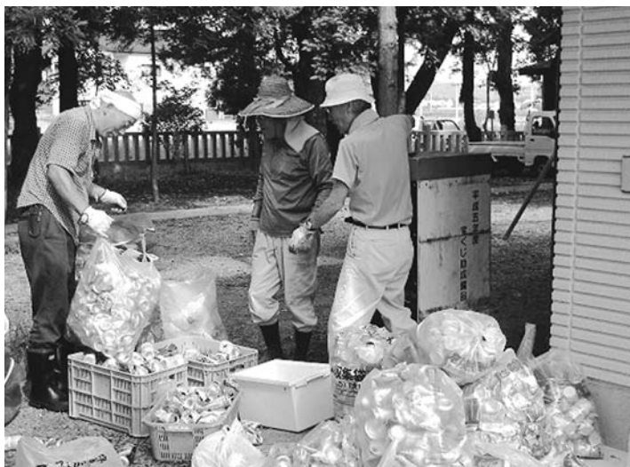
自治会の資源活用