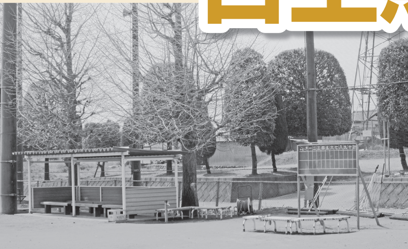
八幡山グラウンド