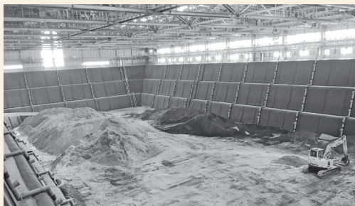
クローズド型処分場（小野上処分場）

平成26年12月に完成。工事費は32億円。施設はオープン型からクローズド型を採用。安全が確保された処分場でした。