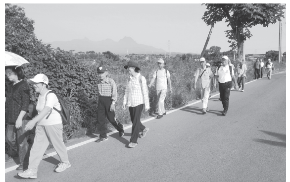
健康No.1プロジェクト「早朝ウォーク」(下野田自治会)