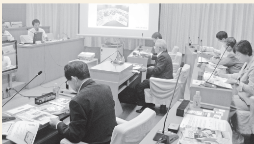
川崎町議会議場にて研修中