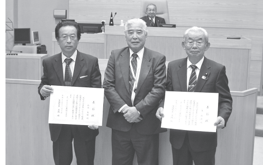
小池議員 石関町長 岸議員