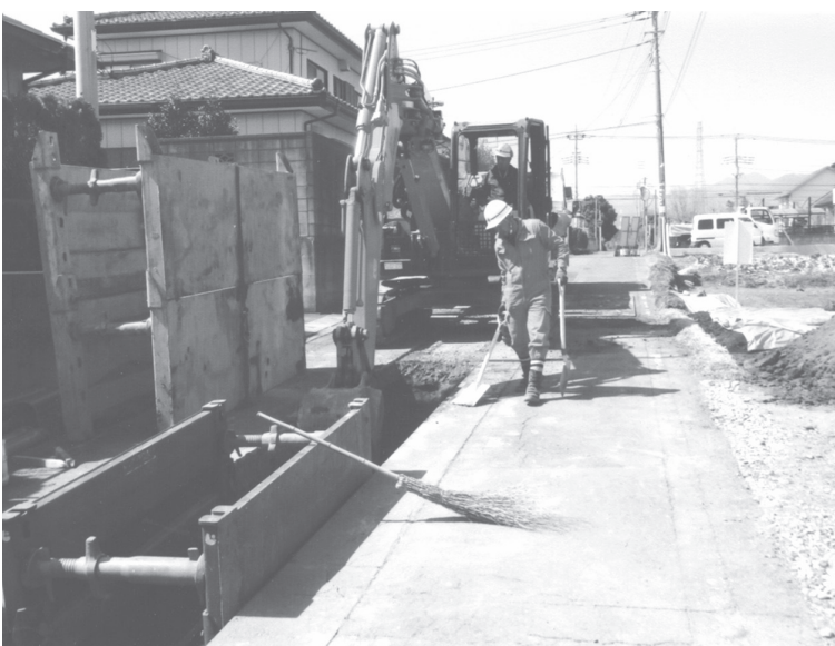
公共下水道区域拡大工事が進む長坂地区