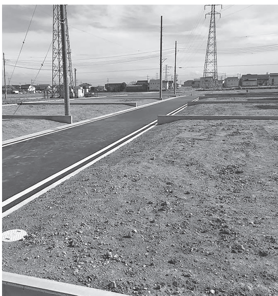
町の各地で宅地造成と住宅建築が進んでいる