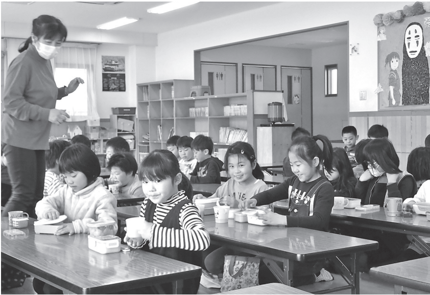
春休み中のため弁当持参のランチタイム（明治第1学童クラブ）

答 駒寄スマートIC東側に予定する大規模開発事業により、基幹の水道配水管に支障が生じることから、移設工事を行うための負担金。