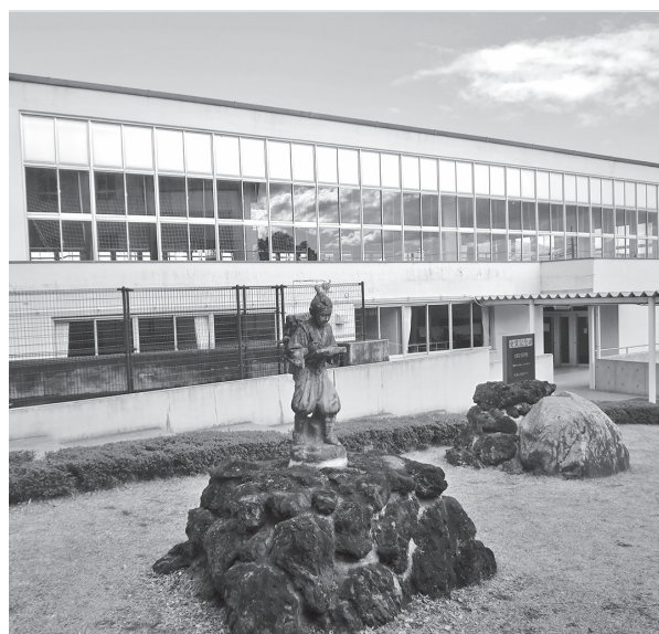
建て替えに伴い解体される駒小体育館

※1 相乗り推奨タクシー 運賃等助成事業 交通弱者のタクシー利 用に支払う運賃などの 一部を助成し、タクシー の共同利用(相乗り) を推進することにより、 外出機会の創出、日常 生活の利便性の向上を 目的とする事業。 ※2 福祉タクシー給付費 在宅で生活するタク シー以外の交通機関の 利用が困難な高齢者や 障害者に対して、タク シー基本料金分の利用 券48枚(月4枚)を世帯 単位で交付するもの。