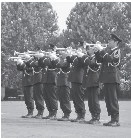
出初式でのラッパ隊