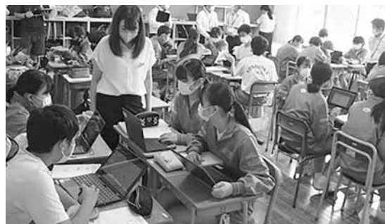
▲学校での学習の様子

URL https://www.satofull.jp/projects/business_detail.php?crowdfunding_id=146