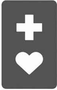
▲ヘルプマーク かばんなどに付けて使います

福祉室または保健センター窓口で申出事由等確認票を記入し、受け取ってください。障害者手帳や診断書などを提示する必要はありません。