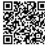
本会議生中継録画配信

また、町議会ホームページで生中継および録画配信を行っていますので、ぜひご覧ください。