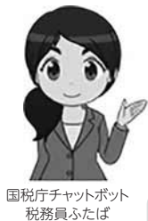
国税庁チャットボット 税務員ふたば