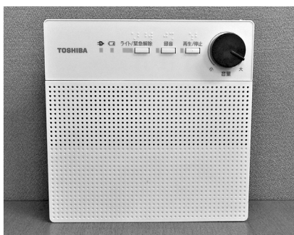
▲デジタル電波対応戸別受信機