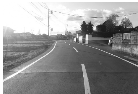
▲舗装された北下地内の町道北下・長岡線