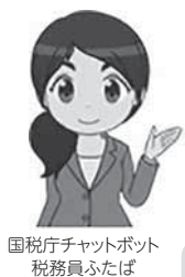
国税庁チャットボット 税務員ふたば