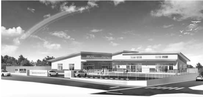
▲新明治第2学童クラブ完成イメージ

いただいた寄付金は、一人一人が輝き、生き生きと暮らせるまちをつくる事業として行う「新明治第2学童クラブ新設事業」にかかる費用に充てさせていただきます。