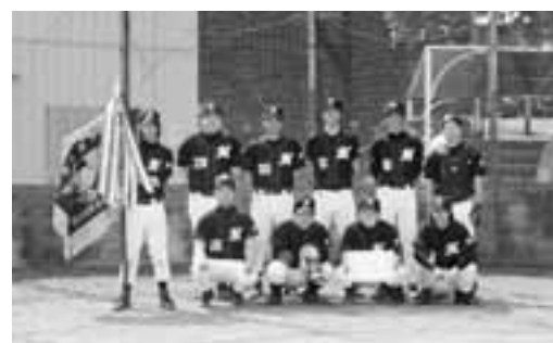
▲Aクラス優勝 群馬丸太運輸野球部