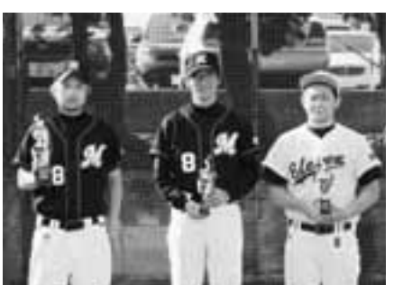
▲Aクラス個人賞の皆さん