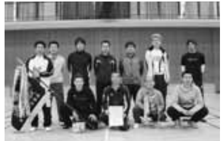
▲男子の部 優勝 南下自治会