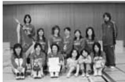
▲女子の部 優勝 下野田自治会