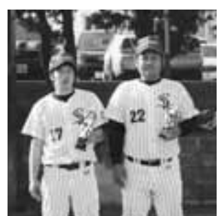
▲Bクラス個人賞の皆さん