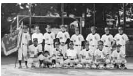
▲Bクラス優勝 株式会社サンワ