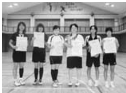
▲一般女子の部入賞者