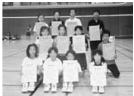
▲小学生の部 前列から小学4年・5年・6年生