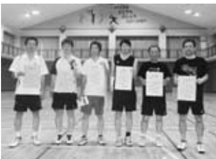
▲一般男子の部入賞者