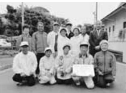
▲グラウンドゴルフ