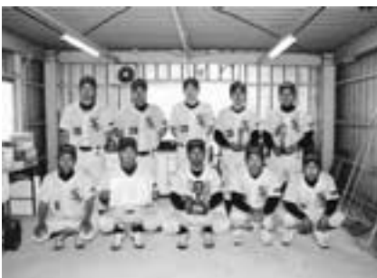
▲Bクラス優勝 (株)サンワ