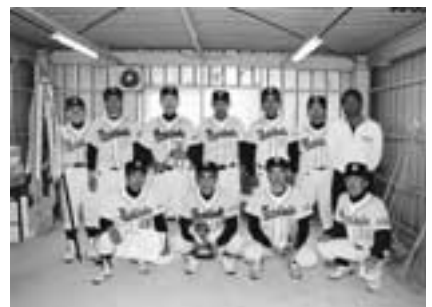
▲Aクラス優勝 吉岡球愛倶楽部