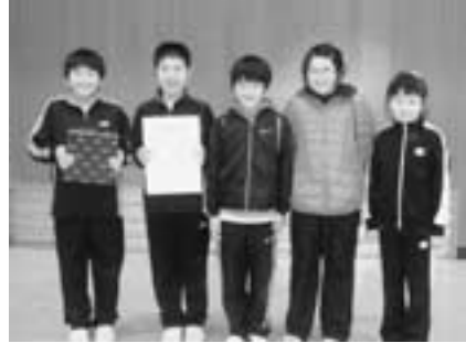
▲団体準優勝 (吉岡ジュニア)