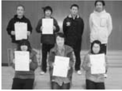
▲個人の部左から優勝・準優勝・第3位