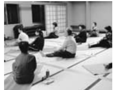
▲やさしいヨガ教室

住民の皆さまが講師となり、受講生といっしょに運営する「よしおが手作り講座」の講師を募集します。 あなたの持っている知識や特技を活かして、楽しい講座を作ってみませんか？ ▼講師対象 町内または近隣に在住・在勤の人（免許・資格は不要）※7月12日④午後7時から行う講師打合せ会議に出席できる人（出席できない場合は要相談） ▼講座の内容 ジャンル不問 ※特定の政党・宗教・企業などの営利に関わるもの、営業による塾・教室などへの生徒勧誘を目的とした講座は対象外です。 ▼指導料 受講生参加費を講師指導料とする ※各講座開催回数に関係なく、一講座につき千円