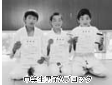
中学生男子Aブロック