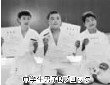
中学生男子Bブロック