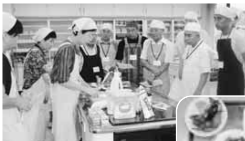
▲ 昨年の教室の様子