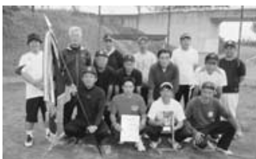
▲優勝 漆原東自治会