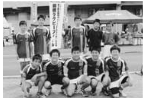
▲全国大会に出場したラグビーチーム所属の吉中生