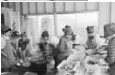
▲おでんの仕込み中