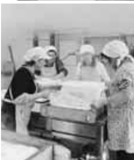
▲ふかしたてのお赤飯