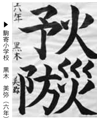
▶ 駒寄小学校 黒木 美弥(六年)