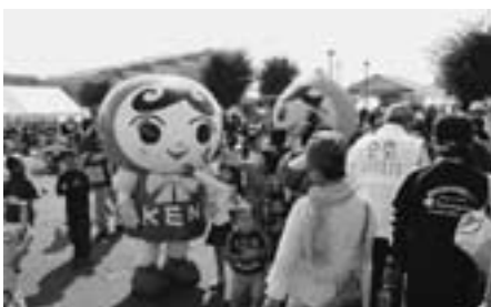
▲人権イメージキャラクター 人KENまもる君 人KENあゆみちゃん （よしおかふるさと祭りで）

期 6月13日⑩ 時 午後1時30分～3時30分 場 吉岡町老人福祉センター 問 前橋地方法務局人権擁護課 ☎027・221・4466（代表）