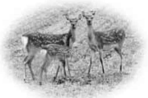
道路を車で走行していると、鹿に出会います。