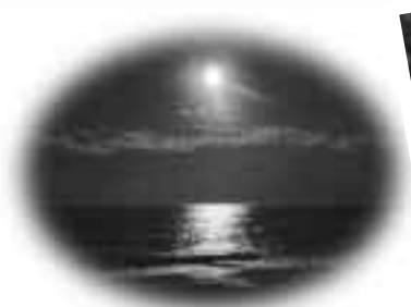
夜の海を散策。暗闇の満月が幻想的でした。