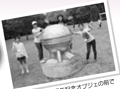
大樹町開町70周年記念オブジェの前で記念撮影