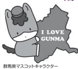
群馬県マスコットキャラクター ぐんまちゃん 許諾第26-100887