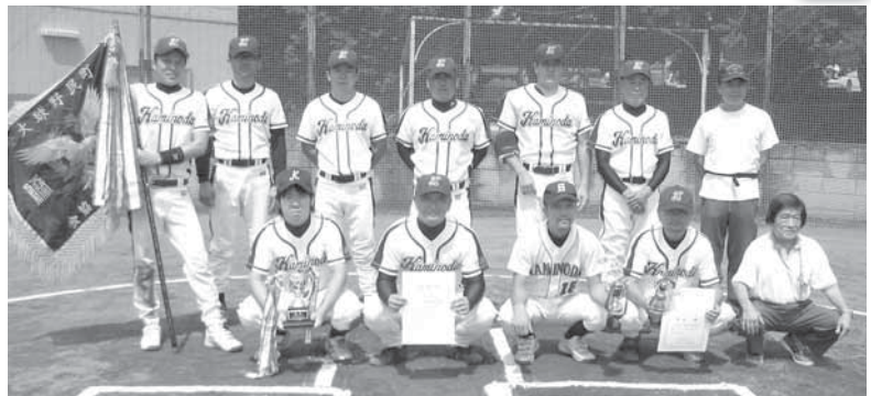
▲優勝した上野田自治会チームは、第60回県町内対抗野球支部予選大会へ出場します。