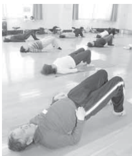
昨年の教室の様子