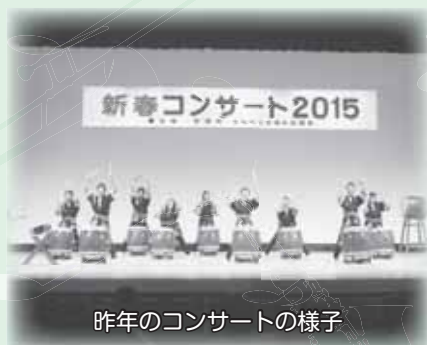
昨年のコンサートの様子